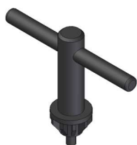
チャックハンドル